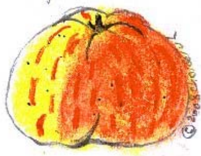
Pastel Choisel Jean-Louis 2008 selon Diel 1842 Kernobstsorten.

En haut : H.Knoop, 1740, Pomologie, pl.6, p.9.